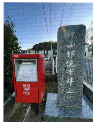
印西郵便発祥之地の石碑 （吉岡まちかど博物館横）